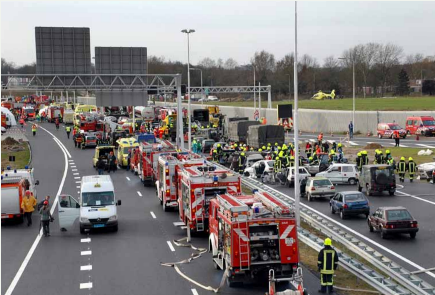
Grootschalige oefening grensoverschrijdende samenwerking bij Roermond in 2007.

Bruls ziet nog wel de nodige uitdagingen op het gebied van grensoverschrijdende samenwerking: "De samenwerking langs de landsgrens kan wel wat nieuwe impulsen gebruiken. We streven bijvoorbeeld naar meer uniformiteit in afspraken met de vier Duitse regio's waarmee wij zaken doen. Een knelpunt is dat er tot dusver geen structurele financiële middelen waren voor grensoverschrijdende samenwerkingsprojecten. Veel hebben we