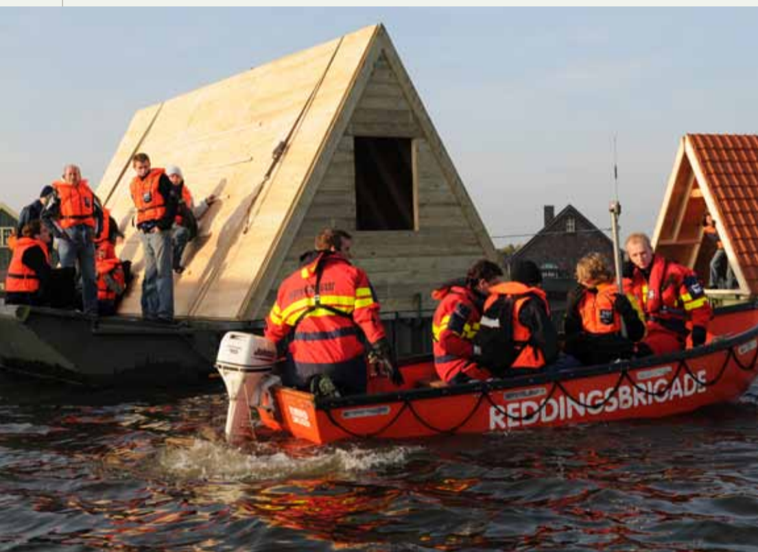
Hulpverleners in actie tijdens de grote oefening Waterproef 2008.

uitleggen aan hun inwoners? "Burgemeesters kunnen zeggen dat er op landelijk niveau een club is die op basis van goede actuele informatie en gedegen analyses de minister kan adviseren over het operationele totaalplaatje bij een dreiging. De overheid doet er alles aan om rampen en crises te voorkomen. Diezelfde overheid zal met man en macht de crisis bestrijden als die zich toch voordoe. En dan beschikt ze over de LOS die daarbij landelijk kan adviseren en coördineren. ///