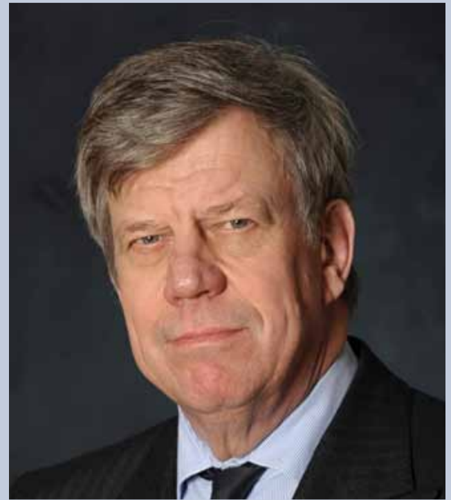
Opstelten: "Discussie schaalvergroting van de veiligheidsregio's nu niet aan de orde."

Met de komst van de nationale politie verdwijnen de huidige 26 politiekorpsen en komt er één landelijk korps onder verantwoordelijkheid van de minister van Veiligheid en Justitie. In het wetsvoorstel is opgenomen dat dit nieuwe korps zal bestaan uit tien regionale eenheden, één of meer landelijk opererende eenheden, zoals nu de Nationale Recherche en één of meer landelijke diensten voor ondersteunende taken, zoals bijvoorbeeld ICT, inkoop, personeel. Aan het hoofd van het korps komt een korpschef die belast is met de leiding van de politie. Door het verdwijnen van de regio's vervalt de functie van korpsbeheerder en wordt het beheer een verantwoordelijkheid van de minister. Ook het regionaal college komt te vervallen. De burgemeesters behouden, samen met de Hoofdofficier van Justitie, de zeggenschap over de prioriteiten van de politie en de inzet van capaciteit in de regionale eenheid. En dat gebeurt - net als nu - met inachtneming van de landelijke prioriteiten die de minister heeft vastgesteld. De burgemeester met het grootste aantal inwoners binnen een regionale eenheid wordt door de minister aangewezen als regioburgemeester. Het gezag van de burgemeester wordt versterkt door in de Wet veiligheidsregio's te verankeren wat de functie is van de lokale gezagsdriehoek.