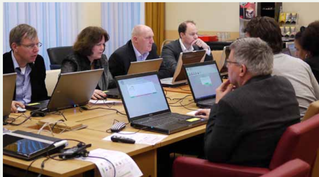
Op 13 januari speelden burgemeesters uit het gehele land, als onderdeel van een training crisisbeheersing van het NGB de burgemeestersgame.

De projectgroep die de serious game ontwikkelde, werd naast genoemde partijen bijgestaan door een klankbordgroep met afgevaardigden uit Noord- en Oost-Gelderland, Defensie en het ministerie van Veiligheid en Justitie. Voor meer informatie kan contact worden opgenomen met Josine van de Ven - TNO: josine.vandeven@tno.nl . ///