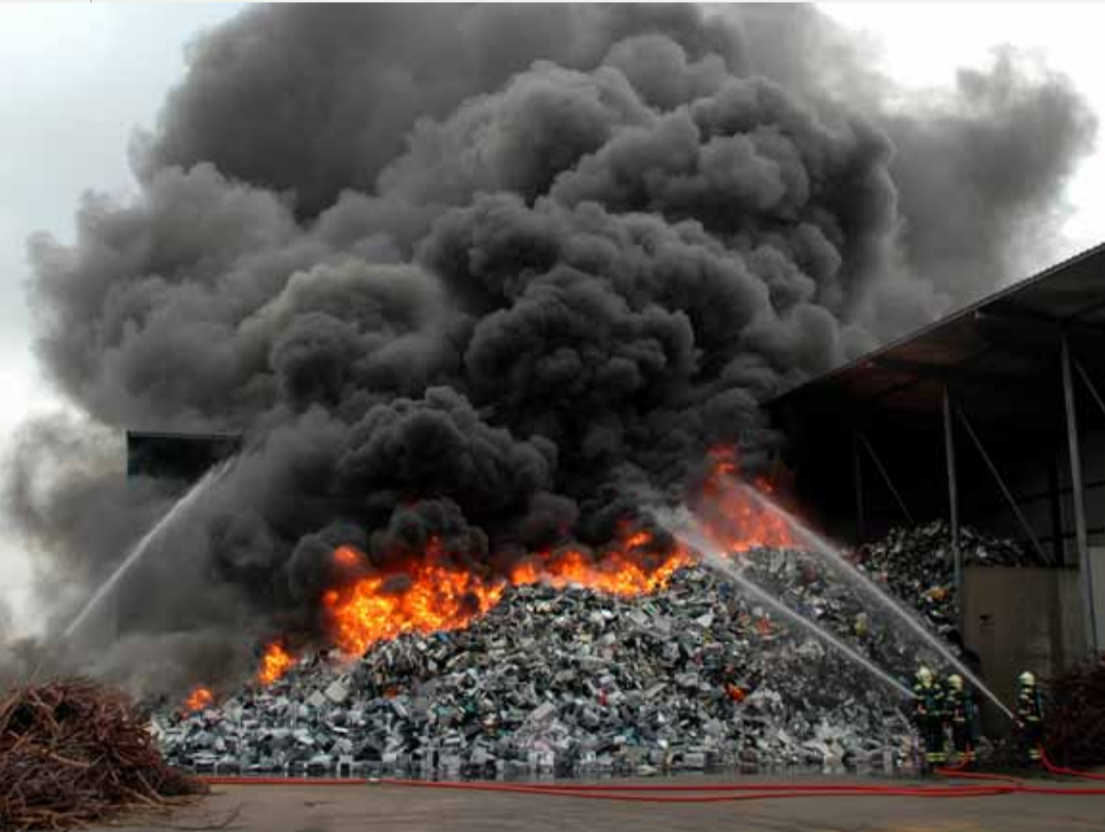
De Milieu Ongevallendienst van het RIVM kan uitsluitend geven over gezondheidsrisico's van schadelijke stoffen in de rook.

Vervuild bluswater na de grote brand bij Moerdijk.